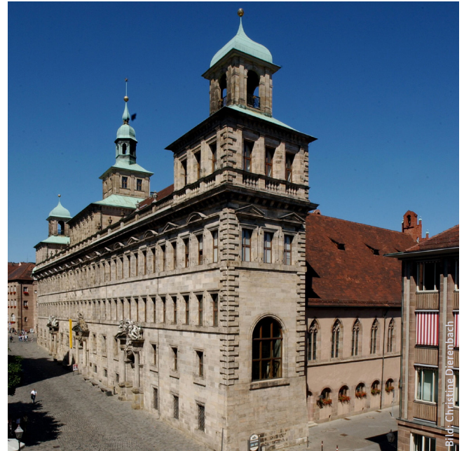
Veranstaltungsort: Historischer Rathaussaal der Stadt Nürnberg

Es findet eine Verdolmetschung des Festaktes in die deutsche und tschechische Sprache statt.